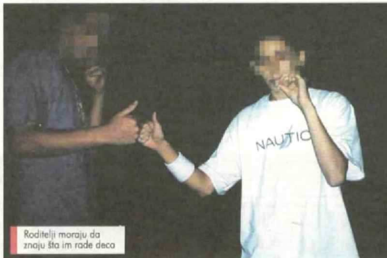
Roditelji moraju da znaju šta im rade deca

Međutim, stručnjaci upozoravaju da su tinejdžeri naj-